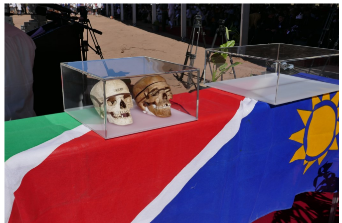
Rückgabe von Schädeln an Namibia im August 2018