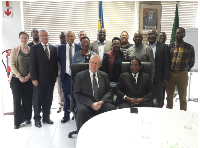
Leiter der deutsch-namibischen Verhandlungen Ruprecht Polenz und Zedekia Ngavirue (t) mit Delegationen 02/2019

Am 04.11.2015 gaben beide Außenminister die Ernennung ihrer jeweiligen Sondergesandten zur Führung des zuvor beschlossenen Dialogprozesses bekannt: für Deutschland war dies MdB a.D. Ruprecht Polenz , Namibias Präsident Geingob ernannte den ehem. Diplomaten Dr. Zedekia Ngavirue .